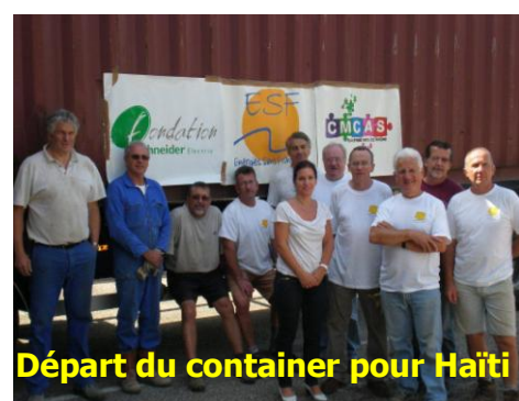
Départ du container pour Haïti