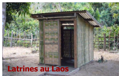
Latrines au Laos

Forage de 4 puits équipés de pompe à main au village de Ban Boumlou pour éviter les longues corvées de portage de l'eau, installation d'une toilette sèche par maison (75 maisons), sensibilisation des villageois à l'hygiène et à la préservation de la forêt et des animaux, éclairage de chaque maison à partir d'un panneau solaire et 2 ampoules, création d'un point de recharge des batteries, mise en place avec le comité de gestion d'une cotisation locale et d'une redevance de charge des batteries, pour disposer de fonds et permettre d'effectuer des travaux d'ordre collectif et l'entretien des pompes.