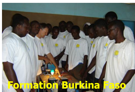
Formation Burkina Faso

Il a pour objectif de former des jeunes sur des secteurs de l'industrie locale d'un niveau BTS.