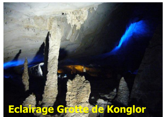
Eclairage Grotte de Konglor

Formation des techniciens d'Electricité du Laos.